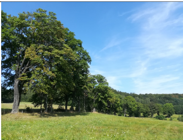
Obr. č. 11

Celkový pohled na hodnotný úsek aleje v úseku Filipovka – Boleslav.