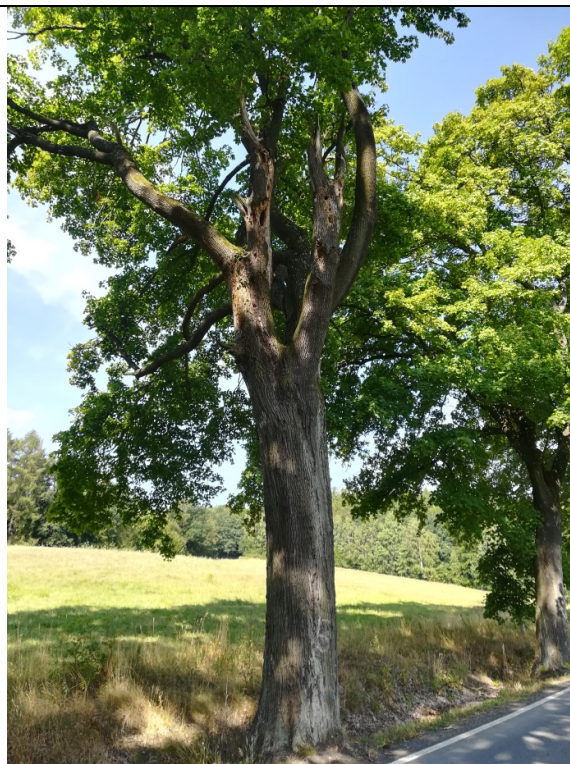
Obr. č. 15

Dřevina je navržena k odbornému ošetření.