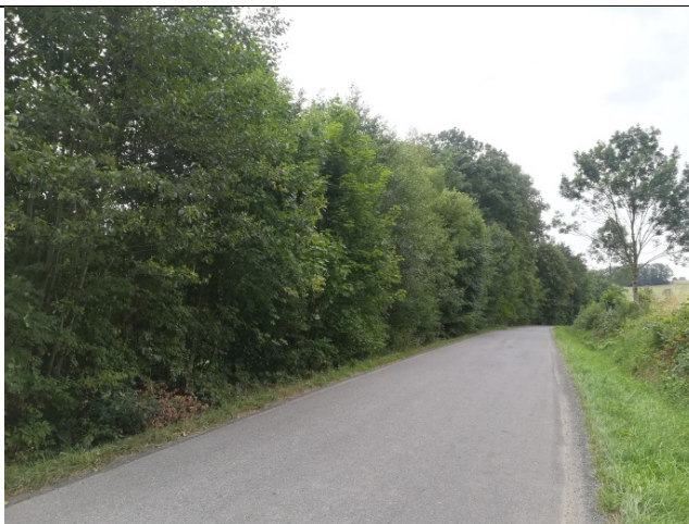
Obr. č. 7

K odstranění je určena část zasahující do průjezdného profilu komunikace.